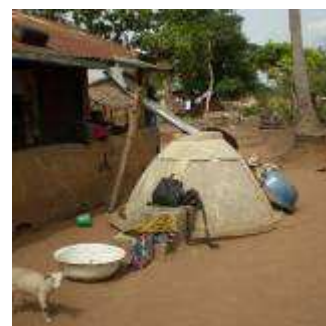
À Amou-Lakoun : réservoir d'eau à domicile (2 à 3 m 3 )