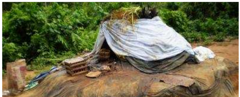
L'autel de la divinité Zèkpon et quelques accessoires de consultation

Vénérée par les Béninois et logée au cœur d'une forêt à la végétation luxuriante, la divinité Zèkpon est surtout connue grâce à une source d'eau du même nom. On y accède par un long sentier de latérite, sur le territoire de la commune d'Avrankou, à une dizaine de kilomètres de la capitale Porto-Novo. Patrimoine de la collectivité Vodounhounhouènou, ses prêtres en sont les véritables gardiens du temple et dépositaires des traditions.