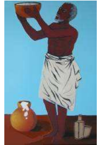
Rite de l'eau en pays vaudou (par un peintre béninois)

Les adeptes de la divinité Dji sont appelés Djissi. Ils portent des appellations, sortes de titres qui précisent les fonctions vitales de l'eau, exhortent à la protection de la ressource ou louent ses bienfaits inépuisables pour les êtres. Entre autres noms et titres liés à l'eau et portés par les Djissi de Savalou, on notera, littéralement retranscrits : « Dji'kotcheayaomo » (on ne joue pas avec l'eau), « Dji'wafoun'omo » (l'eau fait prospérer l'enfant), « Dji'wa laye » (l'eau c'est la vie), « Dji'aye'hin » (l'eau est le moteur de la vie), « Tognon » (l'eau est bienfaisante).