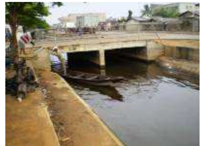
Collecteur d'eaux usées en ville de Cotonou

A Cotonou, la capitale économique, et à Djougou, cité commerciale du nord-ouest, j'ai pu visiter quelques points de regroupements puis la décharge finale. Les eaux pluviales sont drainées hors des villes par des collecteurs. À Djougou, sise sur un plateau, le drainage est chose relativement aisée. À Cotonou en revanche, vu que l'agglomération se trouve en dessous du niveau de la mer, cela nécessite beaucoup plus d'efforts et de moyens financiers. Les deux villes ont en commun de bénéficier d'un partenariat fructueux avec deux communes de France qui leur apportent appuis techniques et matériels.