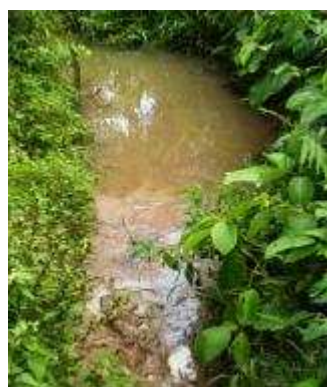
Aux abords de la source sacrée de Zèkpon

L’eau de la source de Zèkpon possède des qualités organoleptiques acceptables : transparente, sans saveur, sans odeur et limpide (quand elle est calme). Mais elle ne doit pas servir aux usages domestiques : pas question de la consommer ni de la cuire, ni de l’utiliser pour la vaisselle ou la lessive. De plus, il est interdit d’aller sur le site aux heures de midi.