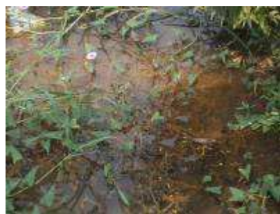
Dans les zones humides, sangsues et cafards ont remplacé crapauds et grenouilles