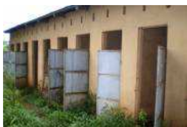
Les lycées ne sont pas beaucoup mieux lotis

Comment en est-on arrivé là ? Par négligence ou ignorance des autorités ? À cause d'actes de vandalisme des usagers ? C'est pourtant une affaire d'éducation, éthique et esthétique, qui ne devrait échapper à personne. Et il faudrait agir très vite car les soins de santé coûtent plus cher que la prévention. À chacun de prendre ses responsabilités et de s'engager selon ses moyens dans cette bataille pour la salubrité publique :