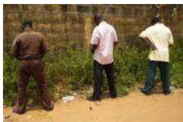
Scène ... courante, dont plus personne ne s'étonne