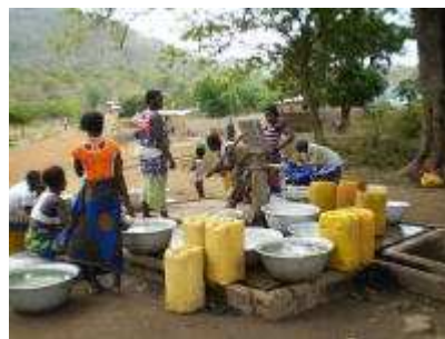
Scène classique autour d'une pompe à motricité humaine : elle fonctionne 24 heures sur 24 et fournit plus de 200 m 3 d'eau par jour

Il importe alors de recenser et répertorier tous les points d'approvisionnement en eau de la commune, de les faire aménager, mesurer leur débit et évaluer leur qualité par des spécialistes avant l'avènement de la saison de pénurie. Il faut aussi les entretenir et ne pas les laisser à l'abandon lorsque les pluies sont de retour. De louables efforts ont été faits dans l'aménagement de forages et de pompes à motricité humaine. Mais, en milieu rural, nombre de villages n'ont toujours pas accès à une eau propre et souffrent de maladies dues à la consommation d'eau douteuse. Le traitement adéquat de ces eaux pérennes amènerait probablement une amélioration de la qualité de vie.