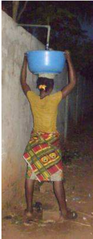
Corvée de nuit

« L'eau nous arrive à pied, tandis que nos besoins prennent l'avion » : l'ironie est fréquente qui dénonce l'absence de rythme dans la réalisation des ouvrages d'eau. Par contre, quand il s'agit d'exploiter les richesses minières, le pétrole, le ciment et autres, aucun investissement n'est assez élevé. Les gouvernements s'y engagent volontiers. Pourquoi traînent-ils les pieds quand il est question de l'eau qui est tout de même la première de toutes les matières premières ?