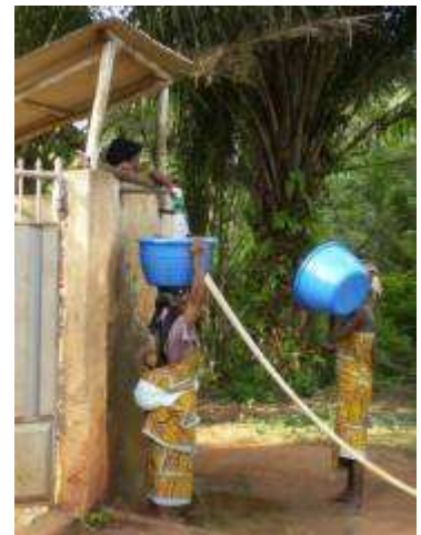
Vente à un poste d'eau

Partout ailleurs ce ne sont que solutions d'attente, pour ne pas dire solutions de fortune : adductions d'eau villageoises, puits à grand diamètre, forages et pompes à motricité humaine. La plupart de ces ouvrages ne doivent leur existence qu'à la générosité d'États ou d'ONG. Mais tous ces efforts, aussi louables soient-ils, et même cumulés, se révèlent très insuffisants compte tenu de la demande d'eau sans cesse croissante. La politique de l'eau s'apparente à du bricolage et du saupoudrage. Elle tient en un mot : échec.