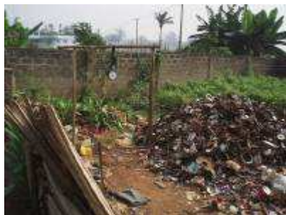
Atelier de récupération, recyclage et vente de ferraille

Plusieurs ONG s'impliquent aussi en faveur de l'assainissement et dans la gestion des déchets solides (recyclage et réutilisation). C'est le cas, en plus de AVP, du « Centre Songhaï », de « Qui dit mieux ? » et de « DCAM-Bethesda » (développement communautaire et assainissement du milieu). Une autre, plus récente, parrainée par un ressortissant indo-pakistanaï, récupère de la ferraille (épaves de véhicule, de matériel électroménager, etc.) en vue de son exportation vers l'Inde. Toutes méritent le détour pour quiconque veut en savoir davantage sur la problématique des déchets.