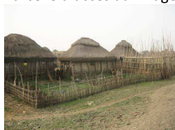
Habitat, enclos pour le bétail et jardin de case