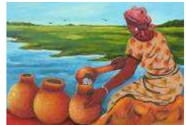
Peinture à l'huile d'un artiste béninois

Dans les familles, la fête du souvenir tient lieu de rendez-vous festif annuel. Les membres se retrouvent au village autour de Tassinon, la prêtresse gardienne de la tradition, qui concocte de l'eau bénite sur l'autel du sanctuaire familial. Laalebasse d'eau bénite fait ensuite le tour de tous les participants de la rencontre. Ce rituel garantit à tous et à chacun la bonne santé, le succès dans les affaires, et la concorde.