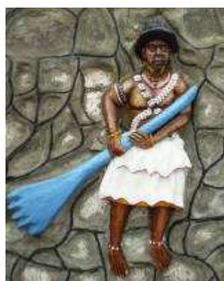
Avlékété, l'une des divinités des eaux (la mer), est munie d'une pagaie

Pour les écologistes des temps modernes, le crapaud est le bio-indicateur par excellence d'un environnement propre, diversifié et biologiquement équilibré. Il montre une grande capacité d'adaptation à son milieu. Les tovudusi , adeptes de ce culte, font dès lors figure d'éco-citoyens avant l'heure, affichant pour principe, entre autres, le strict respect de toute vie, animale, végétale ou humaine. Pour eux, offrir gratuitement de l'eau de boisson à quiconque en demande est un geste sacré et il n'est permis sous aucun prétexte de souiller les eaux destinées à la boisson.