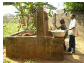
Puits artisanal centenaire (en périphérie de Porto-Novo, capitale du Bénin). Encore en service, il approvisionne quelque 80 ménages.

Les eaux souterraines constituent la principale source d'approvisionnement en eau de boisson : eau courante dans les villes fournie par la Société nationale des eaux du Bénin, forages à motricité manuelle en zones rurales, puits artisanaux à domicile dans tout le pays. L'eau du Bénin (du Nord au Sud) présente toutes les gammes de saveurs, de l'eau douce acidulée propre aux usages domestiques et industriels à l'eau dure alcaline aux usages limités. Le Bénin possède également une vingtaine de sources d'eau douce naturelles minérales et thermales, les plus connues étant les eaux thermales de Hêtin-Sota dans le sud et les cascades de Tanougou et Kota dans le nord.