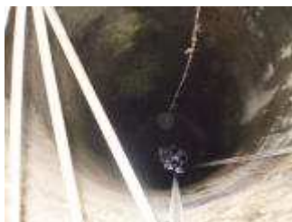
"Le puits du roi", à sec, chacun attend que gicle l'eau