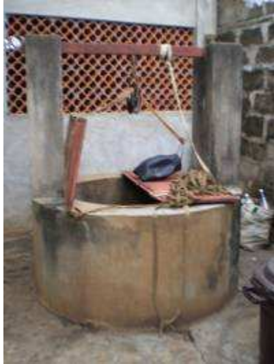
Puits de la famille Capo-Chichi : l'eau est à 22 m de profondeur

Le puisatier n'est pas non plus à l'abri des accidents de travail : rupture de cordeau, chute libre de la charge ou de tout autre objet, terre ou cailloux, chute brutale du puisatier lui-même lorsqu'il entre ou sort du puits ou, beaucoup plus grave, écoulement des parois qui provoque l'ensevelissement du puisatier.