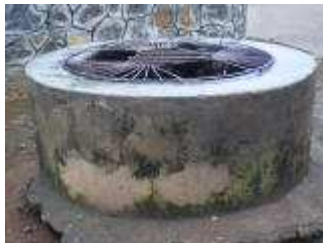
"Le puits du roi", bientôt centenaire