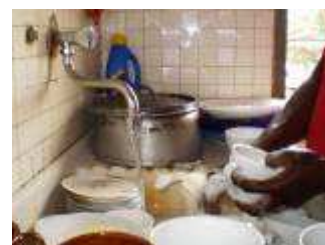
Eau à domicile distribuée par la SONEB : un luxe réservé aux gens des villes qui en ont les moyens.