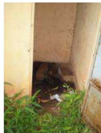
L'entretien des latrines, c'est aussi de l'éducation...

La liste des témoignages recueillis n'est pas exhaustive, je passe le reste par pudeur. Chacune et chacun aura compris qu'il y va à la fois de la santé des gens et du respect de leur dignité.