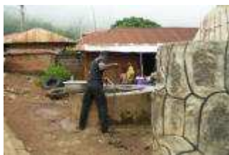
"Le puits du roi", lui aussi rattrapé par l'urbanisation