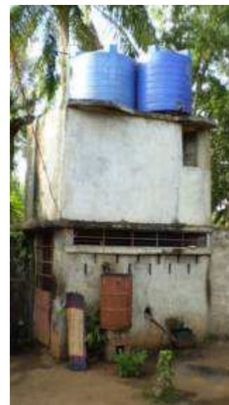
Poste d'eau autonome à Banigbé (Ifangnin)

Avec un investissement d'environ un million et demi de francs CFA (soit quelque 2'500 euros), un exploitant privé réalise un forage, puis à l'aide d'une pompe motorisée, remplit un petit château d'eau d'une capacité de 2 à 3'000 litres. L'eau ainsi obtenue, sans traitement chimique ni bactériologique, est ensuite - sans autorisation officielle - vendue aux populations au prix de 15 CFA (2 centimes d'euro) la bassine de quinze litres.