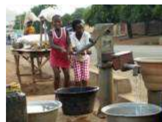
Forage muni d'une pompe à motricité manuelle (à Logbo, Savalou), omniprésent en milieu rural : la qualité de l'eau y est rarement contrôlée.