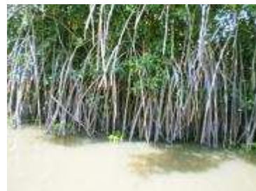
Végétation typique du lac, la mangrove et ses palétuviers sont en voie de disparition

La lutte contre la jacinthe d'eau ne date pas d'aujourd'hui et revêt bien des formes. Il y a un peu moins de vingt ans, on parlait déjà de lutte biologique, en sus de l'arrachage manuel. Cette lutte biologique est efficace, mais lente, voire négligeable au regard de la prolifération et de la croissance exponentielles de la jacinthe d'eau. Sur les plans d'eaux douces, elle est un peu comme les icebergs sur les océans, avec une partie visible et une autre immergée. Ce qui se passe au fond du lac quand la plante se décompose est plus grave encore que sa façon spectaculaire d'en occuper la surface.