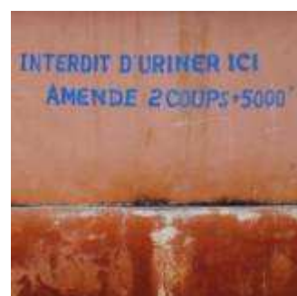
Si le message est clair, il ne propose en revanche aucune alternative