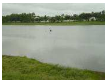
Retenue d'eau de Djougou : les Djougouais ne font plus confiance à la qualité de ses eaux.

Pourtant aucun n'ignore les conséquences sanitaires de la mauvaise qualité de l'eau : diarrhées, gastro-entérites, paludisme. Et surtout la fièvre typhoïde chez les enfants et les nourrissons notamment. Et chacun a bien identifié les menaces : déchets urbains, eaux pluviales non traitées, résidus de pesticides des champs de coton.