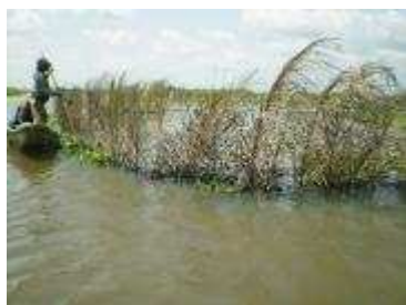
"Acaja", jardin à poisson pour la pêche traditionnelle

Le lac, cadre de vie des 100'000 habitants des villages lacustres, s'est peu à peu transformé en poubelle-égout. Les déchets qu'on y déverse et les eaux domestiques usées et non traitées dopent la ressource lacustre : tel un jardin fertilisé, le lac exerce comme un appel d'air à la végétation aquatique flottante qui réagit sans tarder. Dans cette compétition naturelle à se « mettre à table », c'est la jacinthe d'eau qui se révèle la plus vigoureuse et la plus robuste biologiquement parlant. Du darwinisme !