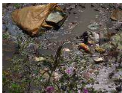
Zounvi, un exutoire naturel devenu égout à ciel ouvert