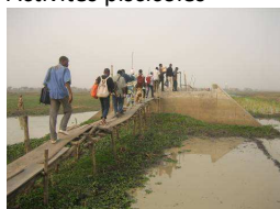
Parcelle d'accès au village