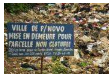
Terrain vague en ville, dépotoir à ordures et à...

Places publiques, plages, rives des cours d'eau, caniveaux, coins et recoins, murs des enclos, terrains vagues : tout endroit est rapidement converti en lieux d'aisance de fortune. Sous les effets combinés du soleil et de la chaleur, ces lieux exhalent des odeurs de matières fécales et d'urine. Et quand arrive l'hivernage, les eaux pluviales se chargent d'en faire la dissolution chimique pour produire un bouillon de cultures bactériologiques générateur d'épidémies.