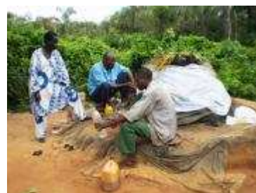
Prêtres vaudous, dépositaires des traditions de Zèkpon

Quand bien même ce n’est qu’une minorité de Béninois qui se sont effectivement rendus sur le site, tout le monde ou presque a entendu parler de Zèkpon. Qu’on reconnaisse ou non la réalité de ses services, on est bien obligé de constater que le phénomène Zèkpon compte dans la vie quotidienne de bien des gens taraudés par l’anxiété et en quête de guérison. Encore faudrait-il que les autorités officielles accordent un peu plus d’attention à l’intérêt populaire croissant pour ces sources et leurs vertus, ne serait-ce, à défaut de confirmer leurs vertus, que pour éviter toutes sortes d’abus. L’eau, c’est la vie, et cela s’applique à la santé de l’âme et de l’esprit autant qu’à celle du corps.