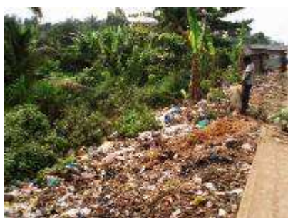
Décharge ... spontanée à portée de main