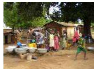
Distribution de l'eau à Miniki