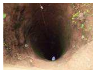
Puits artisanal sans margelle de protection pour l'approvisionnement en eau de boisson : il ne tarit pas en saison sèche.