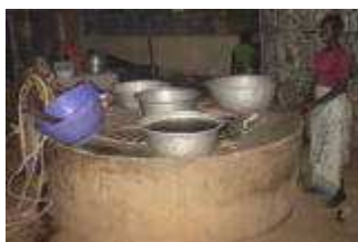
Peu à peu, le soir venu, "le puits du roi" reprend vie

La disponibilité en eau dans la commune de Savalou pendant les mois de décembre à mai est problématique. Pendant cette longue période, tous les puits domestiques n'ont point d'eau, le niveau d'eau dans les quelques cours d'eau pérennes baisse de façon drastique de sorte que la fourniture d'eau courante devient intermittente voire interrompue. Cependant quelques puits, que l'on peut pratiquement compter sur les doigts d'une main, continuent d'assurer l'alimentation en eau. Entre autres : le puits dit « du roi » ( ahosudoto , en langue locale).